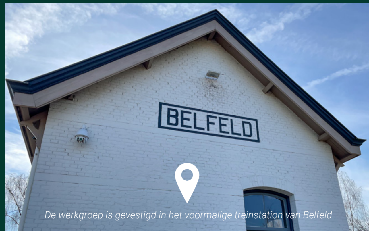
De werkgroep is gevestigd in het voormalige treinstation van Belfeld

in harmonie samengaat met de natuur. Dat is waar wij ons sterk voor maken." Op dit moment doet Tösse Bös en Maas tellingen van vogels om een beeld te krijgen van welke soorten er aanwezig zijn maar ook om te kijken waar de vogels mogelijk verstoord worden. In het gebied zit de oeverzwaluw maar ook een oehoe koppel. De vogelwerkgroep licht toe: "De oehoe is de grootste uilachtige die we in Nederland kennen en is vrij zeldzaam. De oehoe zit in de buurt van de groeve en is daar actief aan het broeden. We maken ons graag sterk voor de oehoe zodat deze vogelsoort in zijn natuurlijke habitat kan blijven."